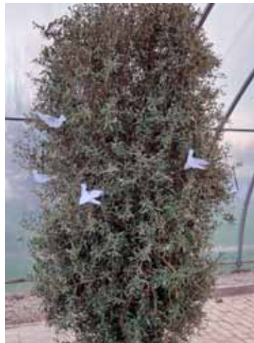
Der Olivenbaum im Gewächshaus – mit Friedenstauben geschmückt

trocken geworden war. Und Gott versprach: „Solange die Erde steht, soll nicht aufhören Saat und Ernte, Frost und Hitze, Sommer und Winter, Tag und Nacht.“ (Genesis 8,22) So ist die Taube zum Zeichen für den Frieden geworden. Um dies greifbar zu