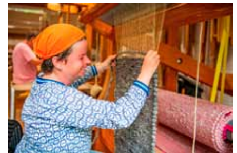
Am 8. Juni ist Tag der offenen Tür in den Magnus-Werkstätten von Regens Wagner Holzhausen

Samstag, 8. Juni – Tag der offenen Tür der Magnus-Werkstätten In den Werkstätten Holzhausen von 11 bis 15 Uhr