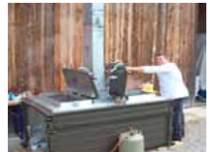
Gulaschkanone in Aktion

Es gibt viele gute Gründe für nachhaltige Vorsorge. Aber eigentlich reicht einer, oder?