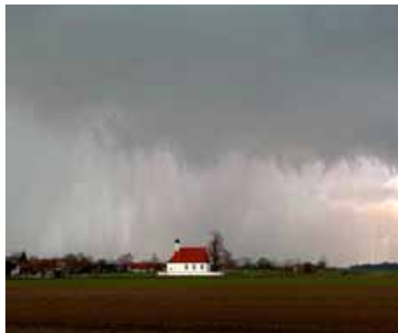
Aprilwetter im März