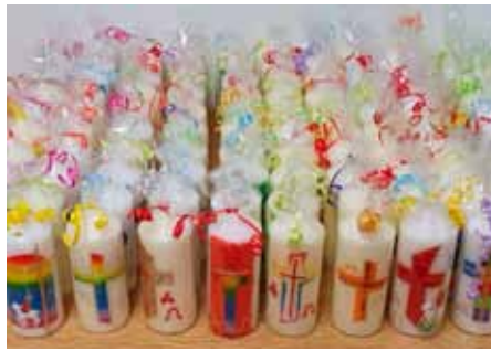
Von der Kreativgruppe gestaltete Osterkerzen

An dieser Stelle möchten wir über die kommenden Termine und Veranstaltungen aufmerksam machen: