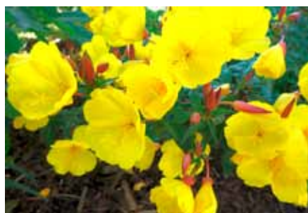
Nachtkerze / Foto: Pixabay

Text: Bayerischer Landesverband für Gartenbau und Landespflege e.V. Foto: Pixabay