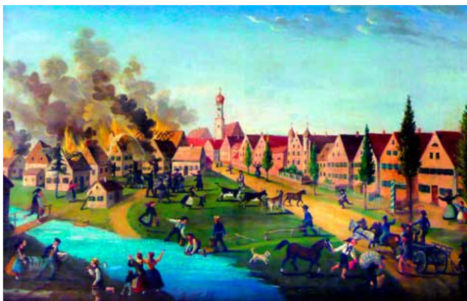
Der große Brand von Holzhausen 1857, Votivbild aus der Rindenkapelle, gemalt von Karl Vorhölzer, Dießen

Um gleiche Zeit wurden die Wasserleitungen 3 Oekonomen von dem das Dorf durchziehenden Bache in ihren Stallungen nach vielfachen Dif-