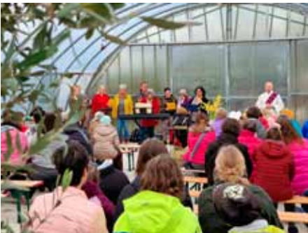
Gelungener Einstieg in die Karwoche: Andacht im Folientunnel am 21. März

Beginn war um 17 Uhr: zuerst kamen Frauen aus dem Seniorenbereich. Weitere Wohngruppen kamen hinzu, auch das Heilpädagogische Heim war vertreten, sogar mit einer Buchloer Gruppe. Sie alle beteiligten sich intensiv an der Andacht, in der – wie bei Diakon Knill üblich – auch