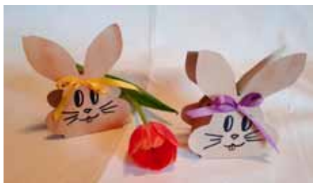
Selbstgefertigte Osterhasen mit Kerzenzielen von Monika Kotzerke

Der Seniorenclub konnte auf ein erfolgreiches Jahr 2023 zurückblicken. Es konnten 13 Veranstaltungen einschließlich 5 Ausflüge mit insgesamt 567 Gästen durchgeführt werden.