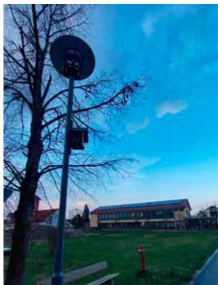
Vogelhäuser an Iglinger Straßenlampen

Im Anschluss gab es im Eingangsbereich des Folientunnels für alle noch eine kleine Überraschung: Früchtepunsch, Ostereier und frisch gebackenen, herrlich duftenden Nusszopf.