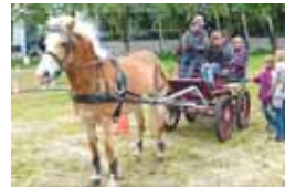
... und mit der Kutsche fahren