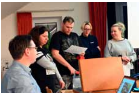
Das Team „Kultur im Gewächshaus“ stellt das neue inklusive Projekt vor.

Großen Raum nahm bei der Mitgliederversammlung das neu entstandene inklusive Projekt „Kultur im Gewächshaus“ ein. Dessen Trägerschaft hat der Verein auf Wunsch von Regens Wagner Holzhausen übernommen. Das Team aus Klien-