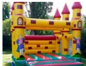
für unsere kleinen Gäste Hüpfburg ...

Am Abend geselliges Beisammensein bei Musik